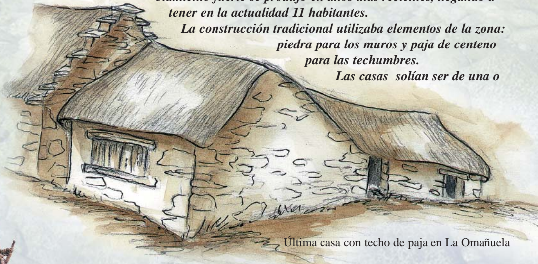
Última casa con techo de paja en La Omañuela